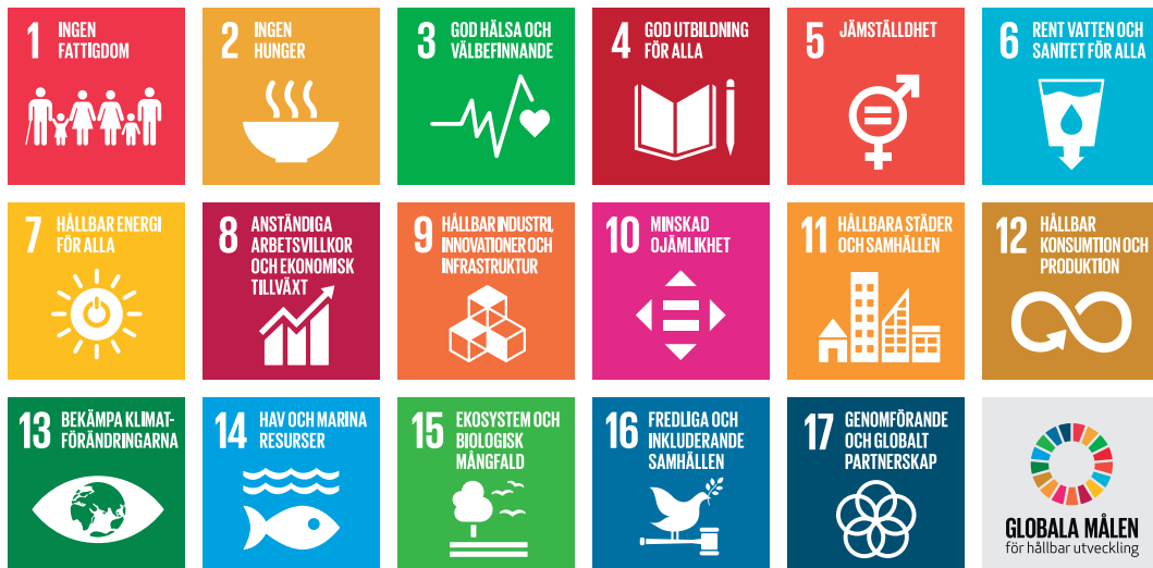
Bilden visar de globala målen inom Agenda 2030.

Hur Göteborgsregionen utvecklas när det gäller de globala målen inom Agenda 2030 är beroende av en mängd faktorer, till exempel konjunktur, lagstiftning och andra offentliga aktörers agerande. I uppföljnings- och analysarbetet ska GR följa utvecklingen för de mål som har relevans för fokusområdet. Detta kan ge kunskap om hur stödet till kommunerna bör utformas.